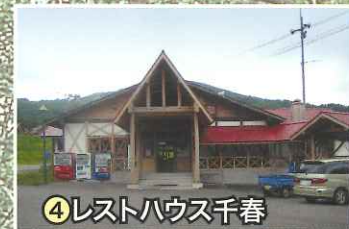
④レストハウス千春