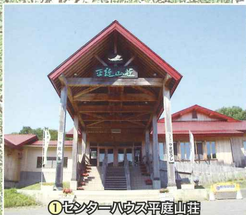
①センターハウス平庭山荘