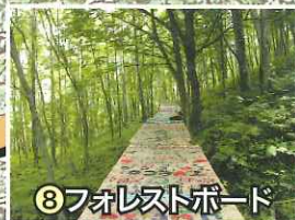
⑧フォレストボード