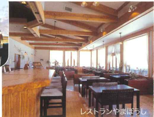
レストランやまぼうし